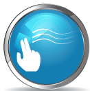
TẠO BỀ MẶT NHẼ MỊN