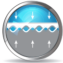
TĂNG ĐỘ BẮM DÍNH